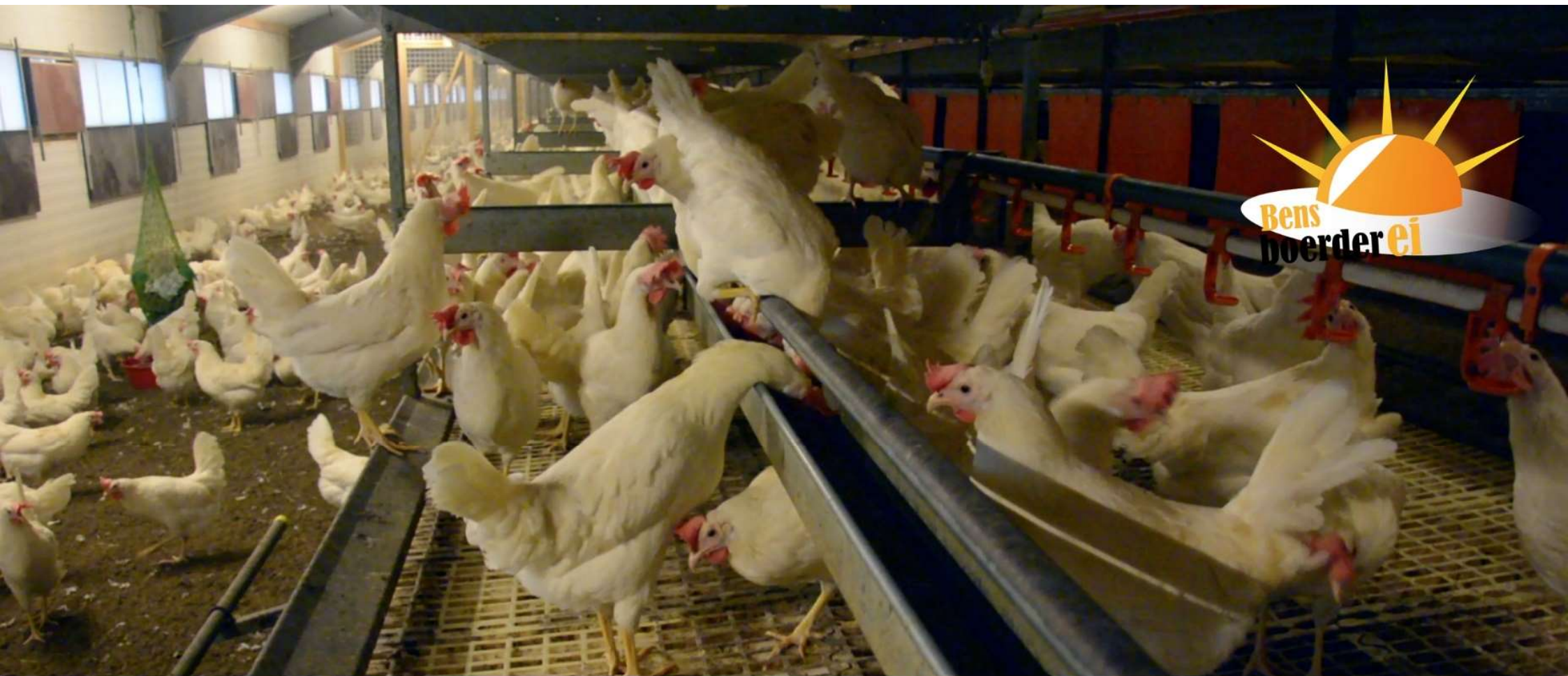
Één dubbel etagestal met een volière systeem met kunstfroosters